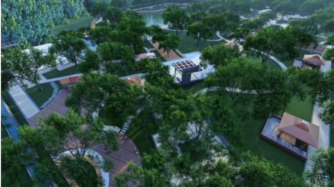
Gambar 4 Community space dan work out