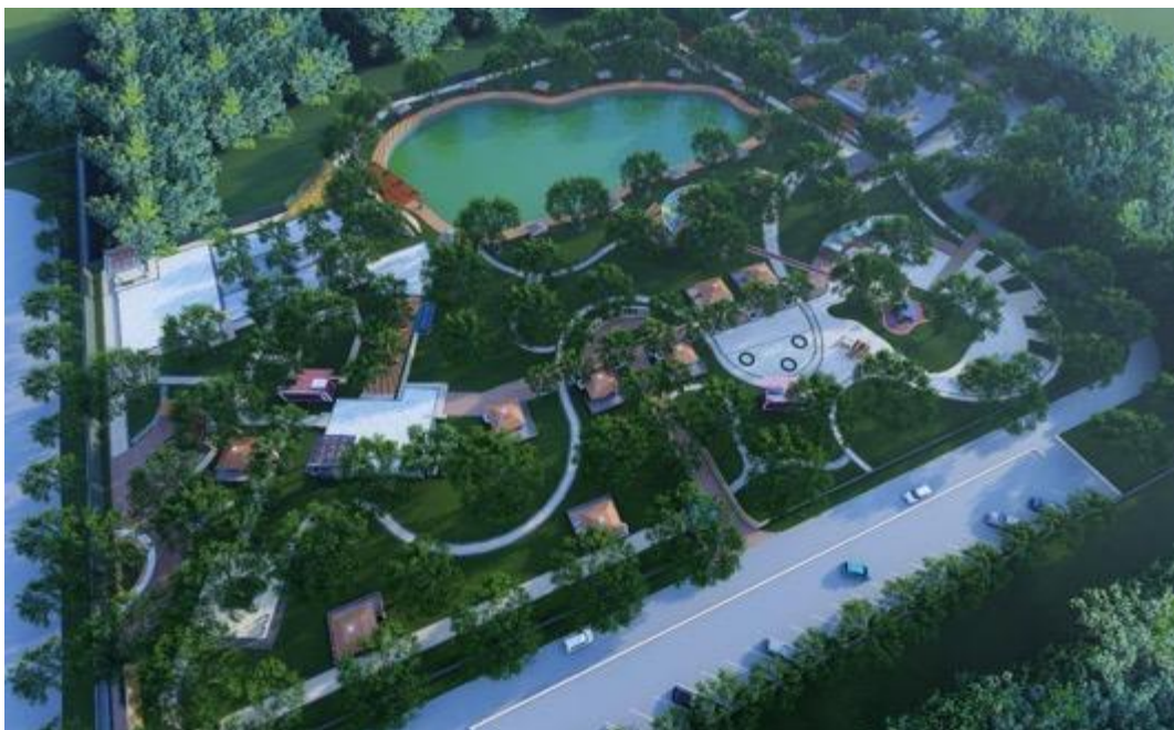
Gambar 2 Desain Kawasan Wisata Waduk

Dari hasil survey dan Analisa kondisi existing didapat bentuk desain yang fokus kepada keberadaan waduk yang sudah terbentuk dan sebagai vocal point bagi pengunjung nantinya. Bentuk desain juga mempertimbangkan pengguna Kawasan nanti nya yang akan mengunjungi dari semua tingkatan umur, yaitu dari anak-anak, remaja, dewasa, hingga lansia. Hal tersebut tidak terlepas dari lokasi Kawasan yang mudah dijangkau dan berada di area perumahan dan pusat kota.