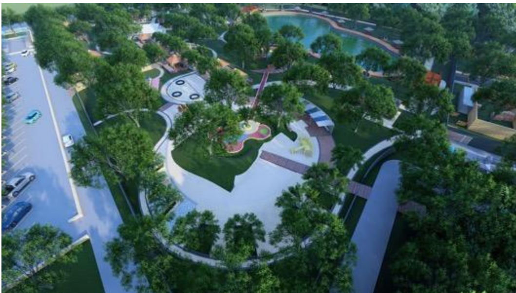
Gambar 3 Area Ramah Anak ( Playground ) dan Parkir

Kawasan ini dirancang dengan bertemakan konservasi alam dengan penanaman Kembali pohon sebagai Langkah penghijauan Kembali Kawasan guna untuk mencapai tingkat kenyamanan didalam menggunakan fasilitas yang ada di Kawasan tersebut nantinya. Adapun fasilitas yang dirancang pada Kawasan ini yaitu: