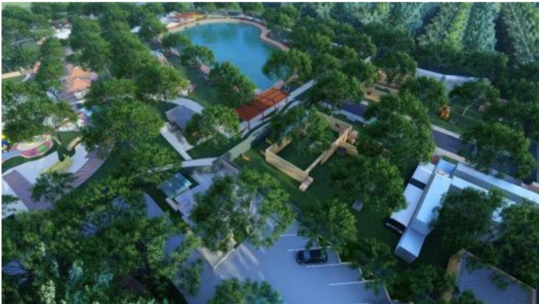
Gambar 5 Area Danau dan Paintball

Berikut beberapa spot area yang ada dikawasan wisata waduk desa wonosari: