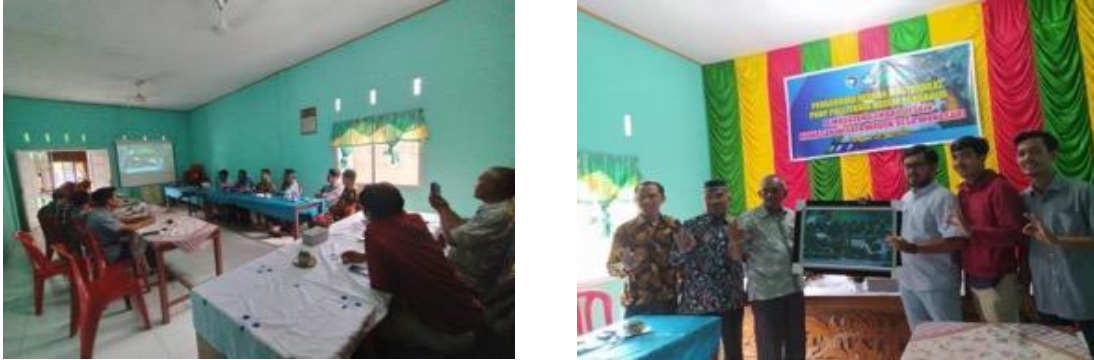
Gambar 7 Kegiatan Pemaparan dan Penyerahan Hasil Desain

Pemaparan hasil dilakukan pada tanggal 20/07/2023 di kantor pemerintahan Desa Wonosari Bersama kepala desa, perangkat desa, tokoh dan kelompok masyarakat dengan beragam profesi. Berikut dokumentasi dari hasil pemaparan dan penyerahan produk hasil desain dari Tim pengabdian Politeknik Negeri Bengkalis kepada Kepala Desa Wonosari.