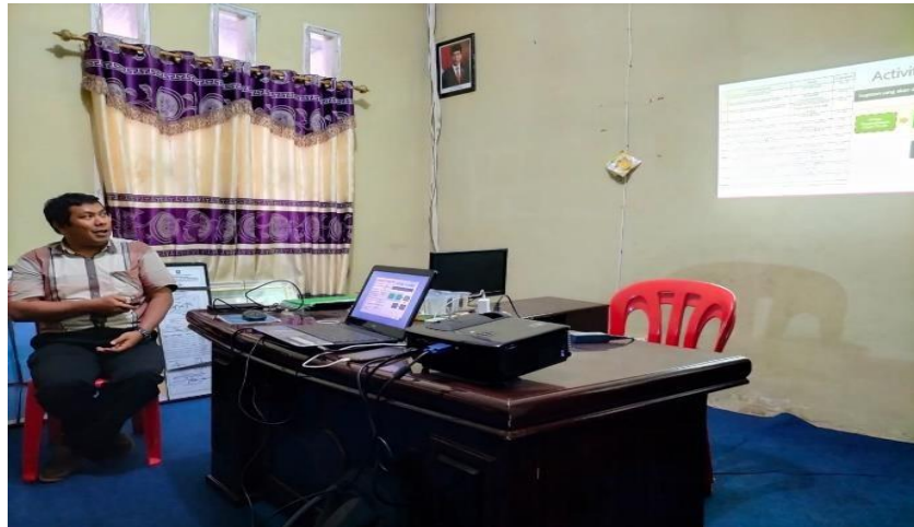
Gambar 3.9 Pemaparan Hasil Desain Pengembangan Kawasan Wisata Sungai