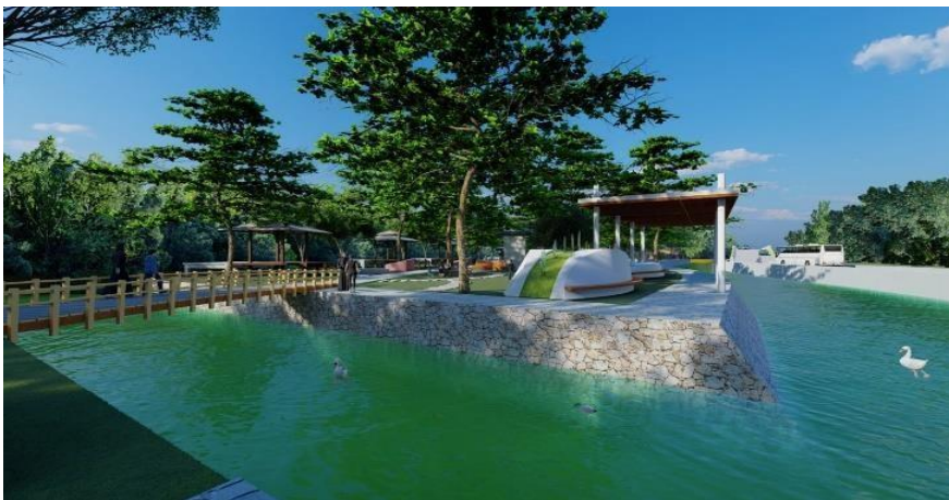
Gambar 3.6 Jalur Kanal Area Kawasan Wisata Sungai Jangkang