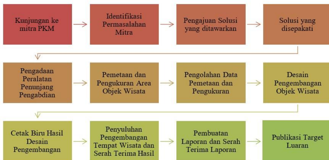
Gambar 2.1 Tahapan Kegiatan Pengabdian Masyarakat

Adapun Metode pelaksanaan dalam kegiatan pengabdian kepada masyarakat pada Desa Jangkang Kec. Bantan - Bengkalis dibagi menjadi beberapa tahapan sebagaimana terlihat pada flowchart berikut: