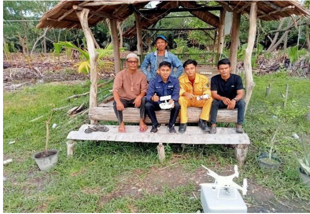
Gambar 3.3 Kegiatan Foto Udara dengan Menggunakan Drone

Setelah semua data foto udara terkumpul maka tahap berikutnya melakukan pengolahan data foto udara, foto udara yang telah diolah menghasilkan gambar seperti pada Gambar 3.4. Dari Gambar terlihat kondisi real dari atas terkait kawasan yang akan direncanakan tersebut.