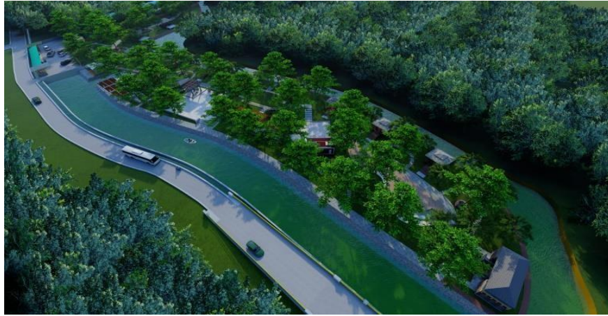
Gambar 3.5 Desain Landscape Kawasan Wisata Area Sungai Jangkang