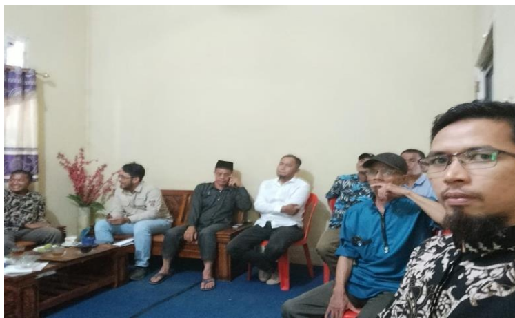
Gambar 3.10 Peserta/Audien dalam Pemaparan Desain Pengembangan Kawasan Wisata Sungai

Tahapan terakhir dari kegiatan ini adalah penyerahan hasil desain kawasan wisata Desa Jangkang, semoga apa yang telah direncanakan segera terealisasi. Penyerahan hasil desain diberikan kepada Kepala Desa dan Ketua Karang Taruna Desa Jangkang (Gambar 3.11 dan 3.12).