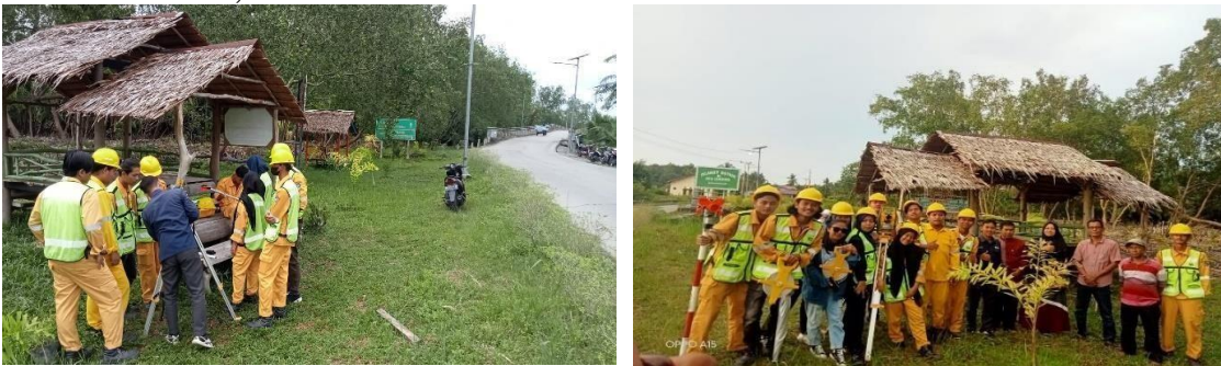
Gambar 3.2 Pengukuran Lokasi Mitra PkM di Area Sungai Jangkang

Dari hasil kunjungan lapangan didapatkanlah solusi yang bisa menyelesaikan masalah yang dihadapi oleh mitra tersebut. Dalam menyelesaikan masalah tersebut ada beberapa langkah yang harus dilakukan, pertama adalah melakukan pengukuran, seperti terlihat pada gambar 3.2. berikut. Kegiatan pengukuran ini melibatkan mahasiswa sebagai studi kasus bagi pembelajaran mereka. Peralatan yang digunakan 1 set theodolit, rambu ukur dan meteran.