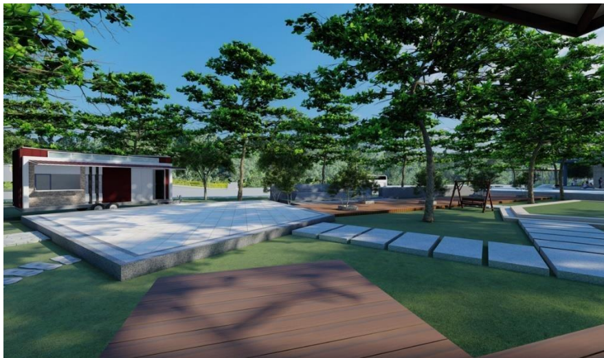
Gambar 3.8 Area Cafe Kawasan Wisata Sungai Jangkang