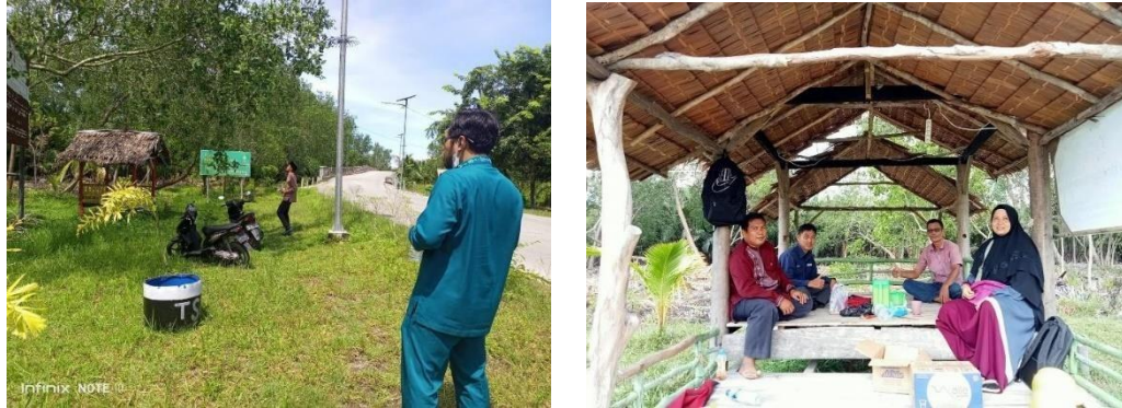
Gambar 3.1 Kunjungan ke Lokasi Mitra PkM (Area Sungai Jangkang)

Kegiatan ini dilakukan untuk bersilaturahmi dengan pihak mitra, yang kami temui adalah Karang Taruna Desa Jangkang, dimana pertemuan ini mengidentifikasi masalah yang dihadapi oleh mitra dan mengetahui kondisi eksisting dari kawasan objek wisata tersebut.