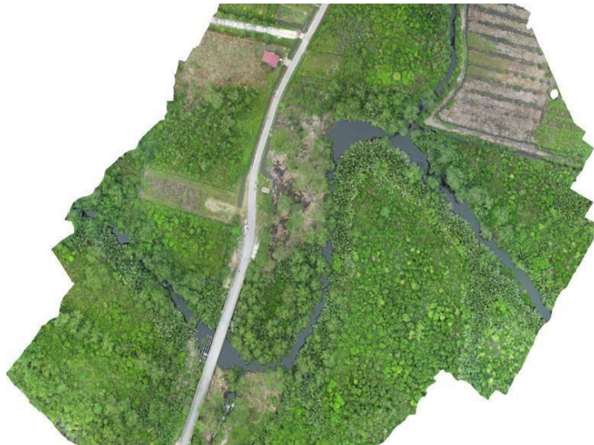
Gambar 3.4 Foto Udara Kawasan Wisata di Area Sungai Jangkang

Setelah semua data foto udara terkumpul maka tahap berikutnya melakukan pengolahan data foto udara, foto udara yang telah diolah menghasilkan gambar seperti pada Gambar 3.4. Dari Gambar terlihat kondisi real dari atas terkait kawasan yang akan direncanakan tersebut.