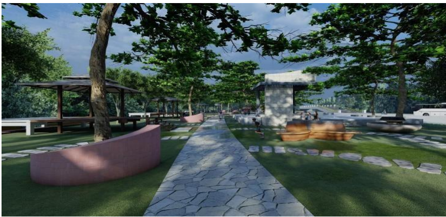
Gambar 3.5 Rest Zone Area Kawasan Wisata Sungai Jangkang