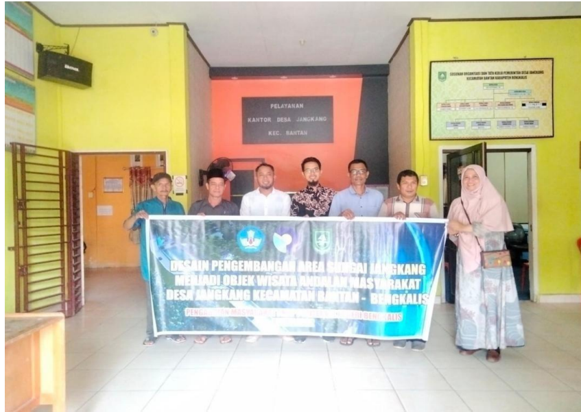
Gambar 3.12 Foto Bersama Acara Penutupan Kegiatan Pengabdian kepada Masyarakat