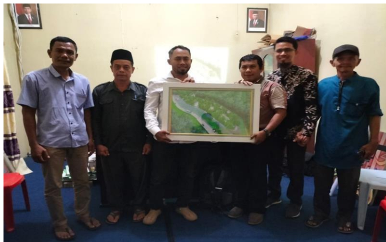
Gambar 3.11 Gambar Penyerahan Hasil Desain Kawasan Wisata Desa Jangkang

Tahapan terakhir dari kegiatan ini adalah penyerahan hasil desain kawasan wisata Desa Jangkang, semoga apa yang telah direncanakan segera terealisasi. Penyerahan hasil desain diberikan kepada Kepala Desa dan Ketua Karang Taruna Desa Jangkang (Gambar 3.11 dan 3.12).