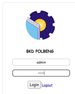
Gambar 3. Halaman login admin

Sistem yang dirancang telah sesuai dengan kebutuhan yang diperlukan, sehingga sistem bisa langsung diimplementasikan di Bagian Umum dan Keuangan, Subbagian keuangan dan kepegawaian Politeknik Negeri Bengkalis. Hasil implementasi dari aplikasi ini dapat ditunjukkan pada gambar-gambar dibawah ini.