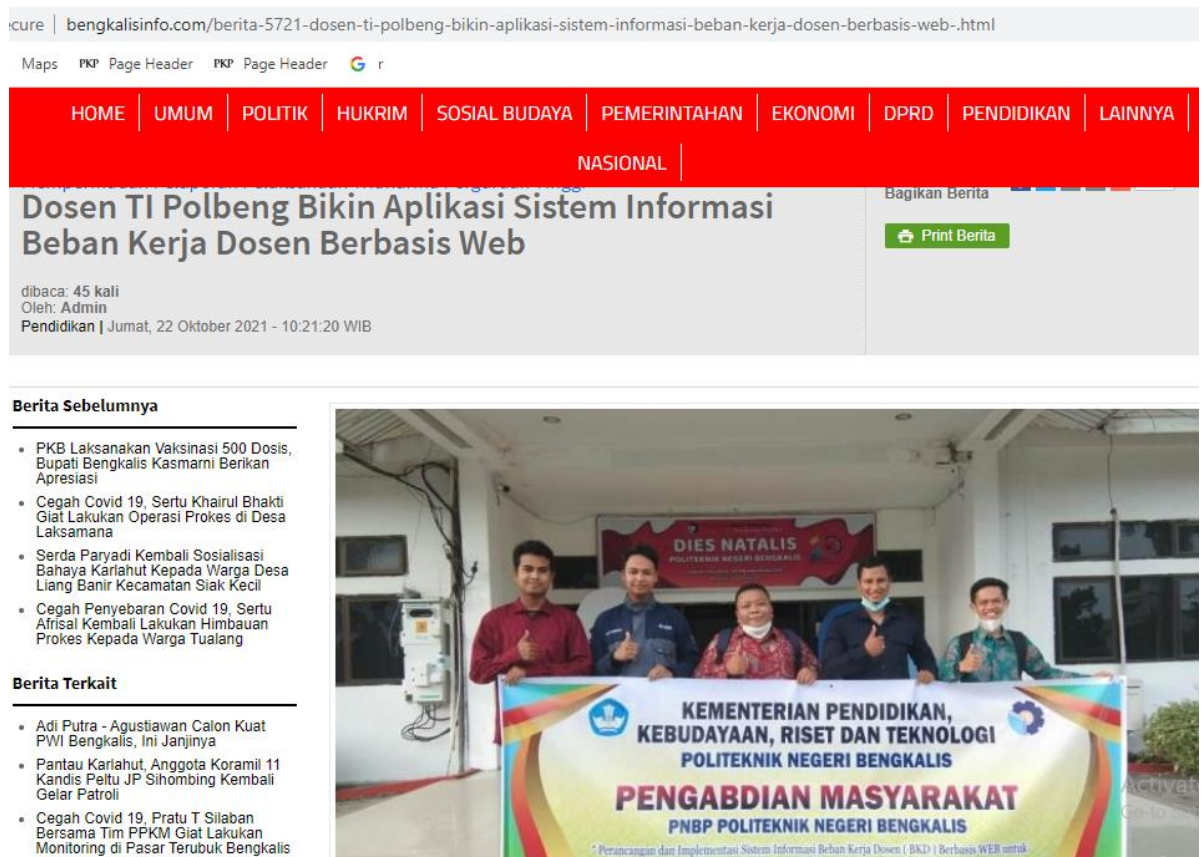
Gambar 8. Berita Media Massa Elektronik Bengkalis Info

Kegiatan pengabdian masyarakat ini telah dipublikasikan di media massa elektronik yang ada di bengkalis yaitu bengkalisinfo.com dengan judul “Dosen TI Polbeng Bikin Aplikasi Sistem Informasi Beban Kerja Dosen Berbasis Web”. Adapun bukti berita media tersebut ditunjukkan pada Gambar 8.