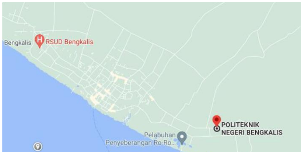
Gambar 2. Peta Lokasi Pengabdian