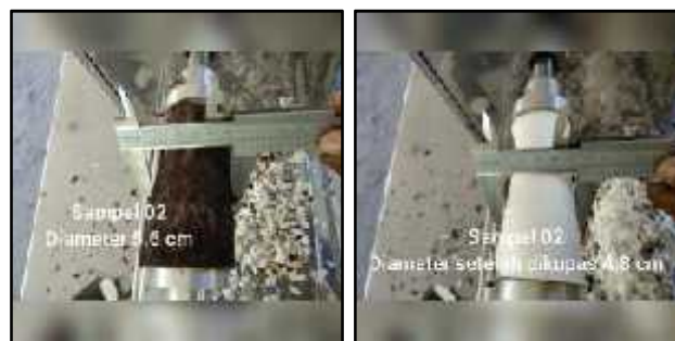
Gambar 5. Hasil pengupasan kulit singkong sampel 2

Untuk sampel kedua, dapat dilihat dari Gambar 5 berikut ini.