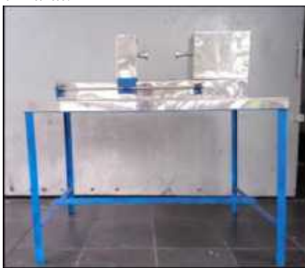
Gambar 3. Alat pengupas kulit singkong dengan prinsip mesin bubut

Bahan yang digunakan untuk merancang Alat Pengupas Singkong dengan Prinsip Dasar Mesin Bubut adalah besi siku dan Besi U, serta Pelat Stainless steel . Besi siku dan besi U dirangkai dan selanjutnya dilapisi dengan menggunakan pelat Stainless steel . Plat Stainless steel terbuat dari campuran beberapa bahan dasar seperti mangan, silicon, nikel, kromium dan karbon. Ada banyak keunggulan yang bisa diperoleh dari peralatan stainless steel. Umumnya, keunggulan stainless steel terletak pada jangka penggunaan yang lebih tahan lama, mudah dibersihkan, sangat kuat dan anti karat.