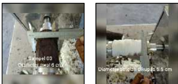
Gambar 6. Hasil pengupasan kulit singkong sampel ketiga

pemakanan potong. Untuk sampel ketiga dapat dilihat pada Gambar 6 berikut.