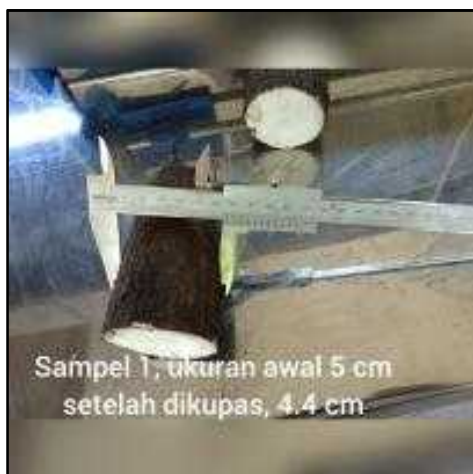
Gambar 4. Hasil pengupasan kulit singkong sampel 1

Untuk melihat hasil dari pengupasan singkong, dapat ditentukan dengan melihat hasil pengupasan yang dapat dilihat dari beberapa sampel. Sampel pertama pada gambar 4 berikut.