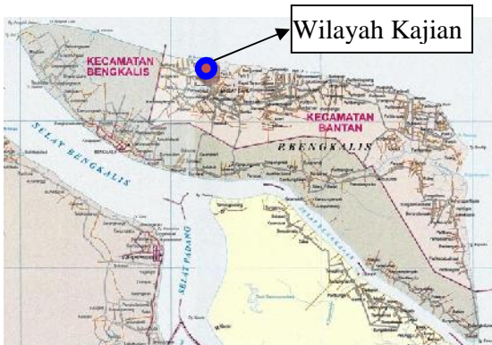
Gambar 4 Peta Pulau Bengkalis

Pada penelitian ini wilayah survey yang dijadikan sampel adalah desa Deluk kecamatan bantan kabupaten Bengkalis. Desa deluk merupakan desa yang mayoritas penduduknya berprofesi sebagai nelayan, selain itu desa tersebut berhadapan langsung dengan selat malaka. Gambar 4 merupakan tempat wilayah kajian ini dilakukan.