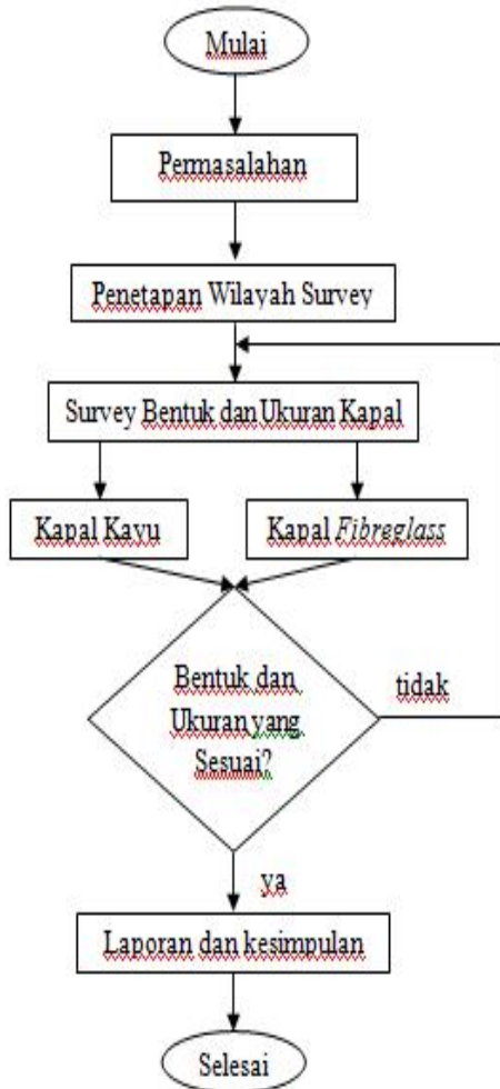
Gambar 3 Flow Chart Penelitian