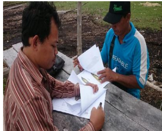
Gambar 9 Penandatanganan bentuk desain kapal plastic

Adapun gambar desain yang dihasilkan adalah gambar lines plan dan gambar general Arrangement pada gambar 10 dan gambar 11.