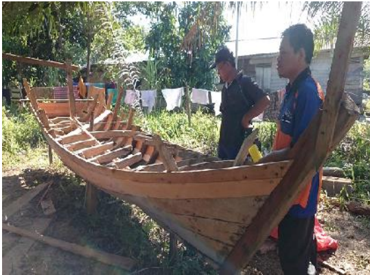
Gambar 7 Model kapal kayu yang ingin dijadikan model kapal plastic

kapal fiberglass -nya dapat dilihat pada Gambar 6, sedangkan gambar model kapal kayu dapat dilihat pada gambar 7.