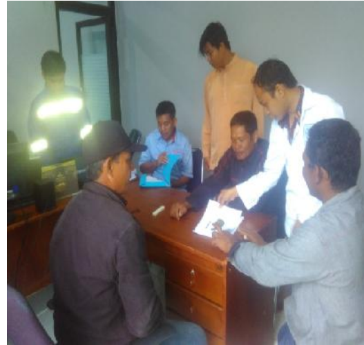
Gambar 8 Diskusi bentuk design kapal plastic

Bentuk dan ukuran dirancang berdasarkan diskusi dengan pengguna yaitu nelayan wilayah selat Melaka. Bukti diskusi antara peneliti dengan pengguna ditunjukkan pada gambar 8 dan gambar 9.