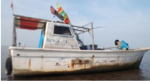
Gambar 2 Kapal Nelayan 3GT Berbahan Fibreglass